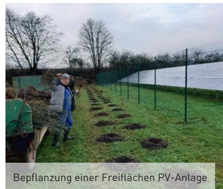
Bepflanzung einer Freiflächen PV-Anlage

Herr Schießl erstellt Ihnen hierfür gerne ein passendes Angebot. Kontakt: 09080-9989023.